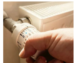
- ILLUSTRATIONS 2 -