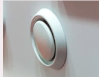
الرسم التوضيحي ١