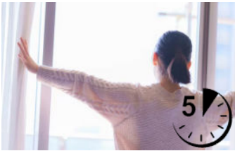
الرسم التوضيحي ١