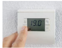
الرسم التوضيحي ٢